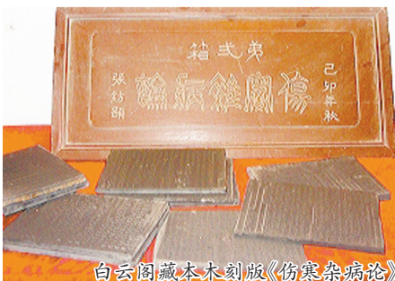
白云阁藏本木刻版《伤寒杂病论》

我们今天所见到的白云阁藏本木刻版《伤寒杂病论》，是经过张仲景反复修订之后留下的原稿，既是孤本，也是绝本。⑦5