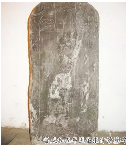
晋咸和五年医圣张仲景墓碑

刘海燕说：“这通晋碑大约立于公元 330 年，距‘医圣’卒年只有 100 余年。历经 1000 多年，这通墓碑能够完好地保存下来，实属不易。它解决了张仲景其人、其墓、汉长沙太守之职等延续千载的学术疑惑和争论，具有重要的文物价值、学术价值、历史价值。”