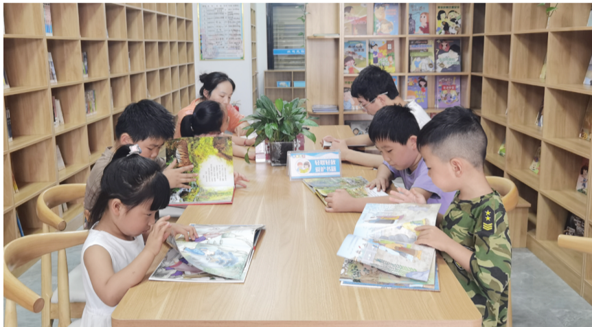
孩子们在阅读绘本。

炎炎夏日,酷暑难耐,许多市民走进清凉安静的图书馆、诸葛书屋、书店,阅读、学习“充电”,在浩瀚书海中寻得一丝清凉,充实自己的生活。