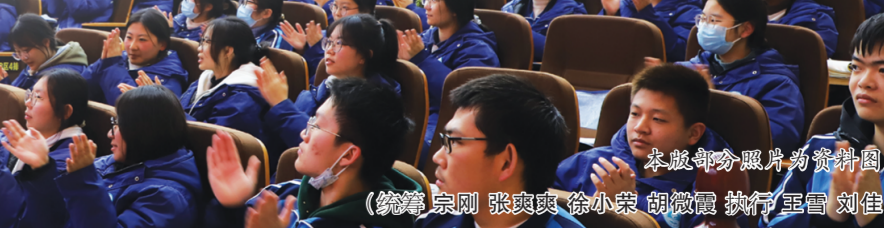
本版部分照片均资料图片 (编辑 朱刚 张爽爽 徐小棠 胡微霞 执行 王雷 刘佳霖)

我很庆幸,在高一进入王好国老师的班级,那是学校最好的班级之一,班里的各科老师都有自己独特的魅力。王