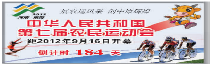
2012 河南农民运动会 第七届农民运动会 距 2012 年 9 月 16 日开幕 倒计时 184 天