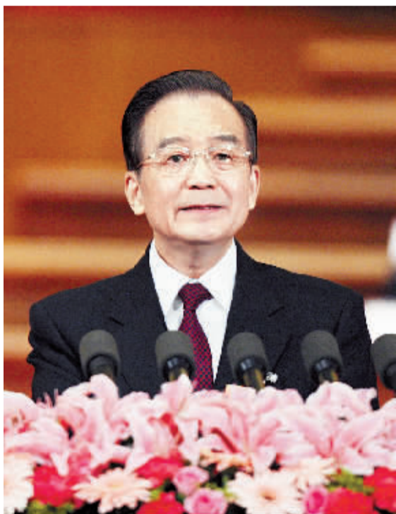
3 月 5 日,国务院总理温家宝在第十一届全国人民代表大会第五次会议上作政府工作报告。