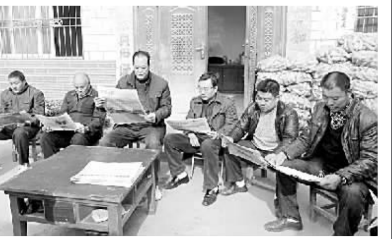
方城县杨集乡张庄村党支部认真学习十八大精神。

主动服务。该局结合十八大关于生态文明建设的总体要求,为企业开发新品、节能环保、财务核算、降低成本、拓展市场、增加盈利等提供建设性意见和建议。①7