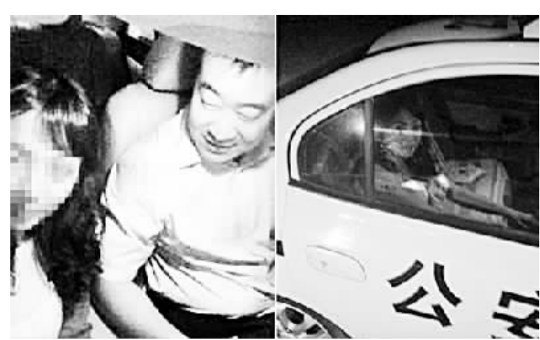
“雨美人o”在微博上炫耀“老公”开警车泡温泉的相关照片

报道还称, 三亚市公安局一工作人员透露, 根据微博图片一眼就看出那辆车不是三亚警方的车, “三亚警方的车都是越野式的警车, 并没有桑塔纳式的警车”。