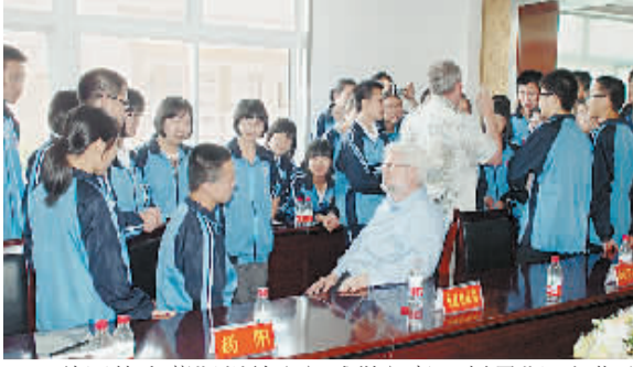
美国德克萨斯州教育部长访问南阳一中