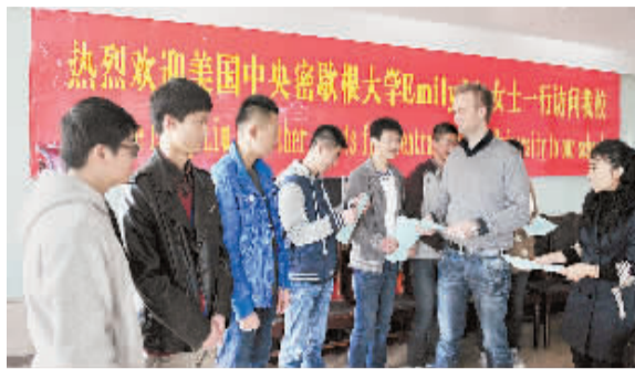
中央密歇根大学来校为中美国际班学生颁发录取通知书