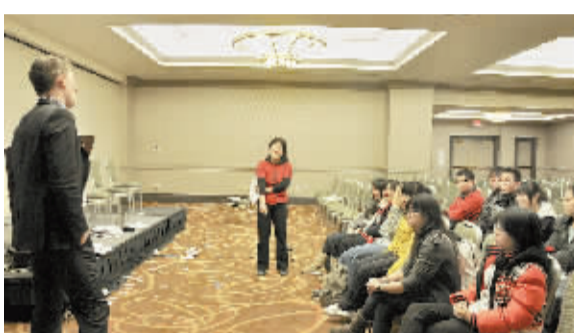
游学美国学生与哈佛师生交流互动