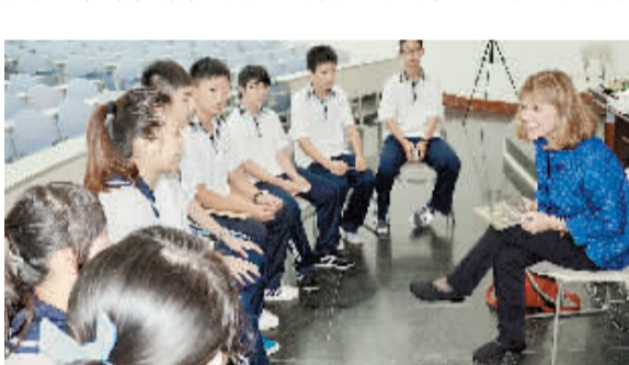
波特兰州立大学面试现场