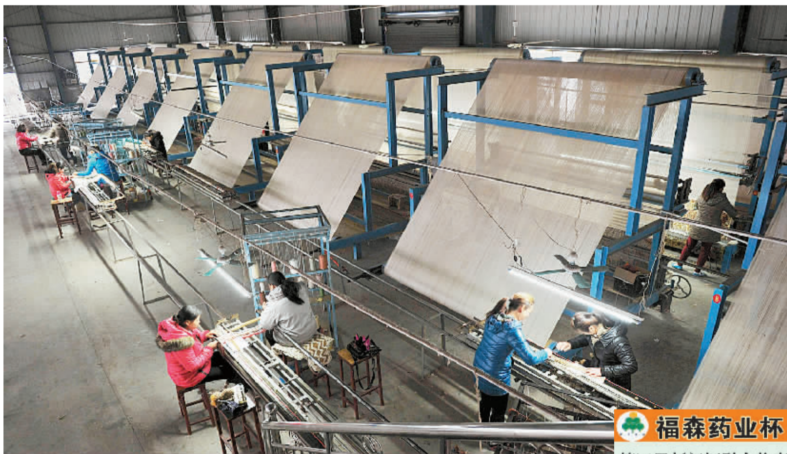
南召县产业集聚区着眼品牌建设,着力技术创新,研发生产的真丝、丝毛交织地毯等产品远销美、日、韩等 30 多个国家和地区。图为河南盛明实业有限公司地毯车间。③

召开多层次的专题学习会议。针对当前全县整体工作已进入集中攻坚和冲刺收尾阶段的实际,该县对重大项目建设、农业生产、扶贫开发、民生保障、安全维稳等工作重点部署,要求全县上下进一步增强全面深化改革的责任感和紧迫感,以学习十八届三中全会精神为动力,对当前各项工作进展情况进行“回头看”,并对照年初确定的目标任务和各类责任书,逐项梳理,查漏补缺,倒排工期,加大工作力度。③