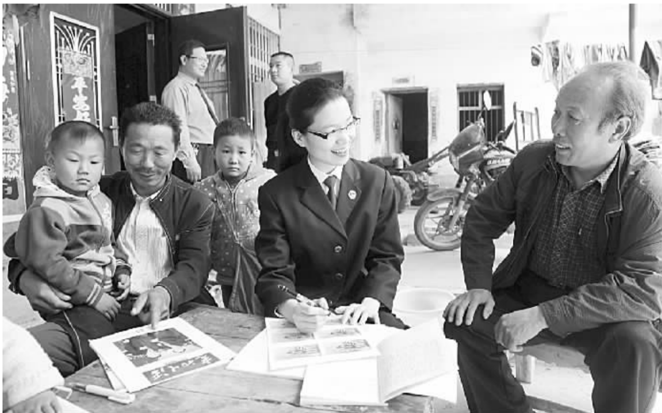
5月9日，内乡县检察院反贪局的干警在赵店乡长岭村走访群众，和村民签订《党群连心卡》，为困难群众解决具体问题。(线索提供：丁俊良)

本报讯(通讯员李雪)近日，南阳卷烟厂工会以“安康杯”竞赛活动为载体，在全厂范围内开展群众性安全生产监督检查活动。要求各级领导干部“身”入车间、“心”贴现场，及时掌握一线职工的生产生活信息，排查与治理安全隐患。(线索提供：丁俊良)