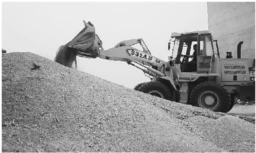
在卧龙区蒲山镇丁庄村收购点, 一台铲车正在装运刚刚收购的小麦。③8

责任到位。该县粮食局与下属购销企业签订“收购目标责任书”12份, 落实收购计划15万吨; 完善奖惩机制, 细化任务, 责任到人, 激发员工收粮热情。仓储到位。筹措资金1100多万元, 整修、扩建仓库200多座, 小麦入库准备工作就绪。人员设备到位。依托乡镇粮所, 培训质检、检斤、开票、结算、付款等人员250多人; 维修、更新输送机、检测仪、通风机等设备669台, 满足“三夏”粮食收购需要。措施到位。鼓励粮食企业发挥贸易收购优势, 自筹资金、代收代储; 落实托市收购预案, 严格执行小麦最低收购价政策, 切实保护农户利益不受损失。服务到位。组织100多名志愿者, 成立宣传服务队15个, 积极为农户提供信息指导和上门服务, 确保“三夏”粮食收购工作顺利开展。③8