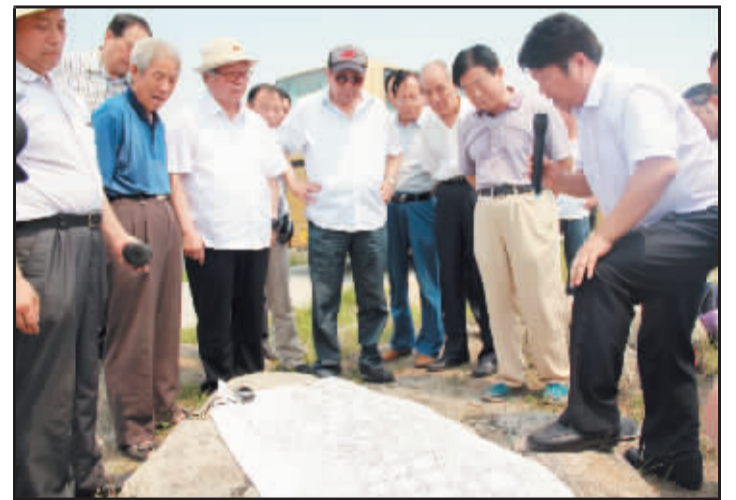
退休老干部一行在鸭河工区参观岩画遗迹。