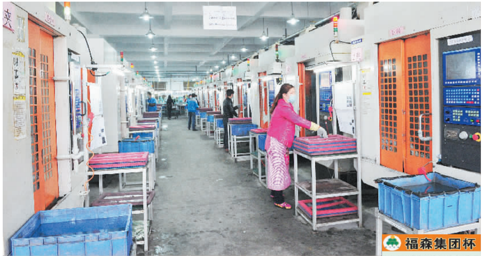
位于卧龙区光电产业集聚区的荣阳铝业(南阳)有限公司总投资 37 亿元,项目全部达产后年可实现产值 65 亿元,将带动 1.5 万人就业。③6

理群众投诉举报,对不构成违纪违法情形的不作为、慢作为、乱作为责任人给予组织处理。深化“三亮三评”活动,对群众反映强烈的不作为、慢作为、乱作为问题进行公开报道、及时曝光,依法受理办结行政机关提出的非诉行政执法案件,开展失职渎职类犯罪的警示教育、普及预防职务犯罪的有关知识等。对不作为、慢作为、乱作为的查处及问责情况将纳入所在单位所在地的党风廉政建设考核、科学高效发展绩效评价以及文明单位创建的考评内容。③6