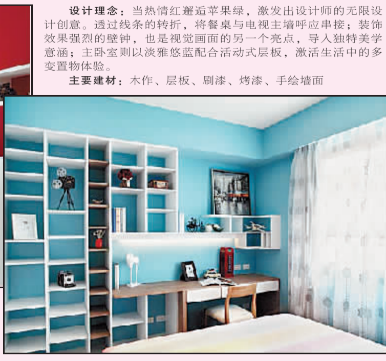
▲卧室设计: 淡雅悠蓝配合活动式层板,预留生活各式的想象可能。