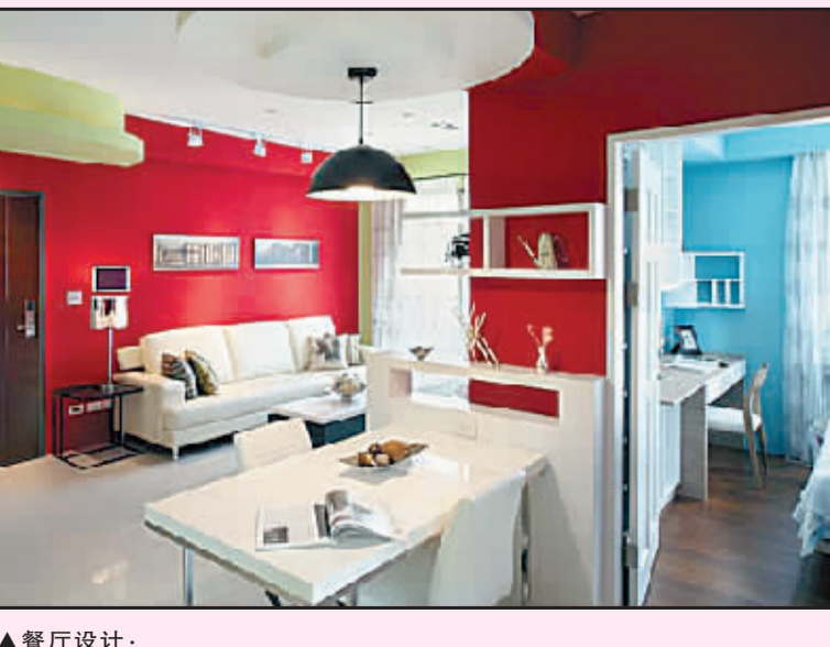
▲餐厅设计: 餐厅墙面强调空间情境的分享与交流,透过线条转折与电视主墙呼应串接。