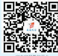
家电维修微信平台