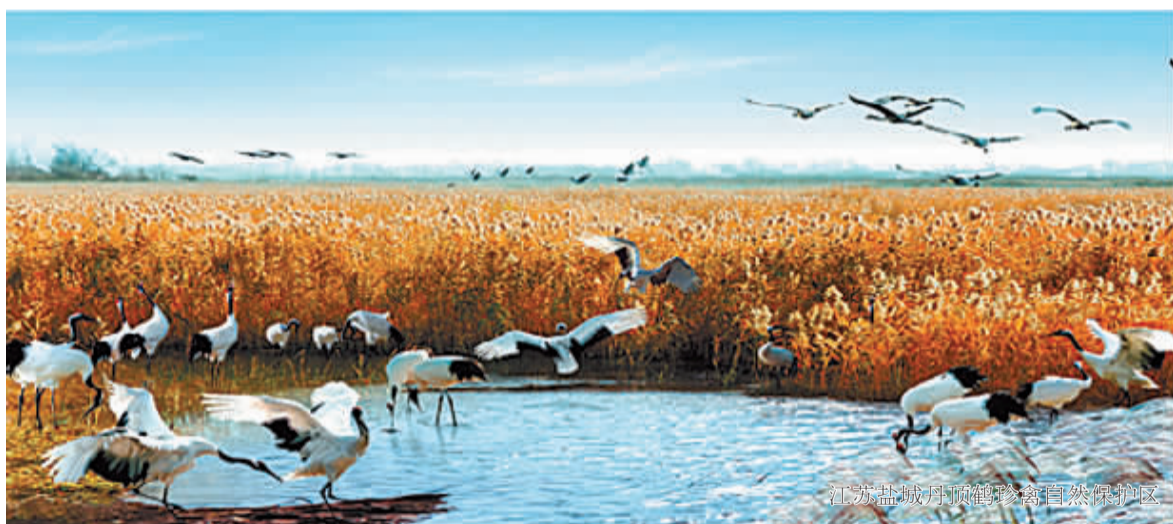
江苏盐城丹顶鹤自然保护区