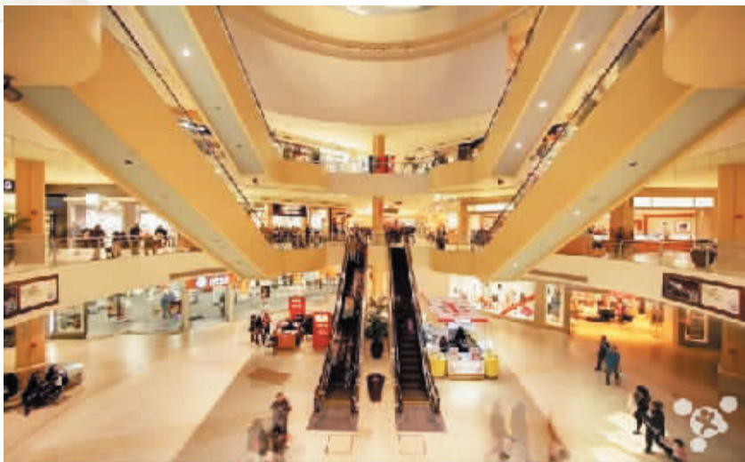
图为苹果纽约旗舰店

2014年2月份,世界上最大的比特币交易商 Mt Gox 因遭到网络袭击而崩溃,虚拟货币受到重创,至今未能恢复。分析家依然担心比特币交易缺少安全性和监管,但也有企业家对其充满信心。为了推动比特币成为主流支付方式,一家公司已经推出比特币 ATM 机,另一家公司还推出了比特币借记卡。