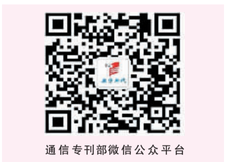
通信专刊部微信公众平台

此外,如果运行微信、QQ 时,图片、头像或“朋友圈”的内容读不出来,可能是手机内存卡已存储满或损坏,应及时清理或更换。(囡囡)