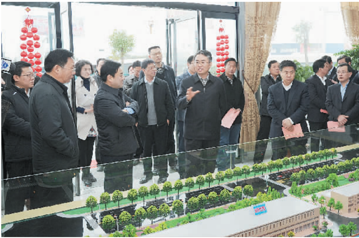
市委书记穆为民率第一观摩组在方城县特色商业区“鸿福物流”观摩