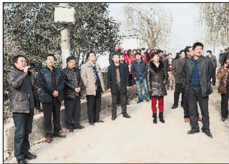
领导实地踏勘项目

未动而先谋，稳步而迅猛。新大地公司凭着诚信和精心赢得了人们的口碑，取得良好的经济和社会效益。