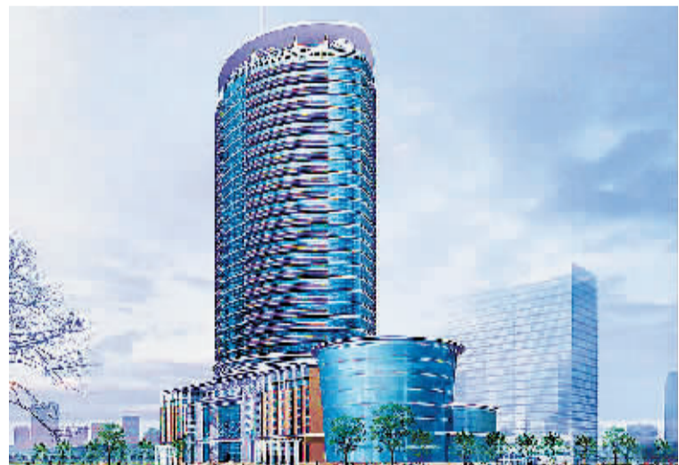
三门峡陕州“慧丰大厦”项目效果图