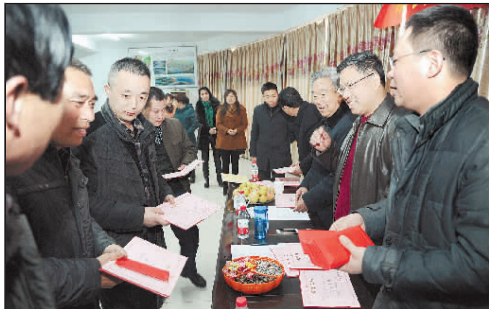
新大地房地产优秀员工表彰大会