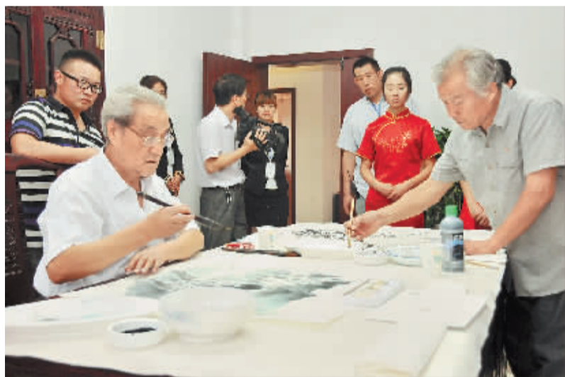
书画名家现场演示授课