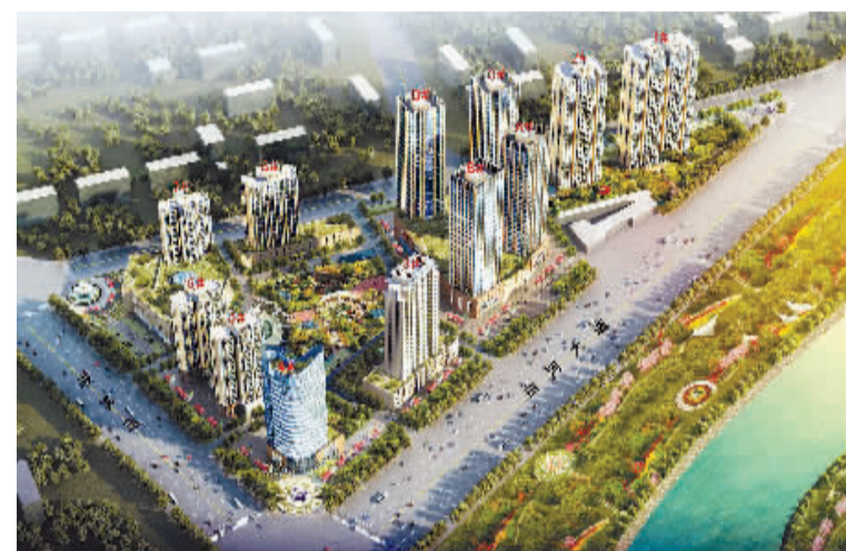
枣林“城中村”改造项目鸟瞰图