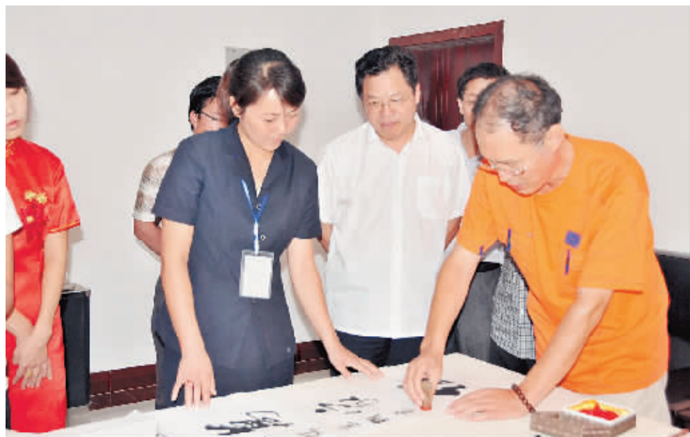
提升企业文化素养

文化塑造凝聚力，文化塑造战斗力。凭着雅致的文化素养和以人为本的企业导向，新大地公司赢得了市场，这厚重的文化财富将使它融合于社会而长盛不衰。①