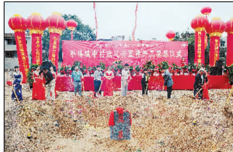
建设宜居家园，造福万千百姓