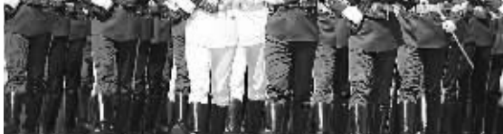
5月9日,在俄罗斯首都莫斯科红场,中国人民解放军三军仪仗队方队行进在阅兵式上。

早在1931年9月18日,日军自导自演“事变”,在欧洲战端尚未开启之时,就掀起侵略中国的序幕。在相当长的时间里,中国独力支撑着东方战场的局面。1937年7月7日,中国的全民族抗战,开辟了世界反法西斯的第一个大规模战场。正如毛泽东指出的,中华民族的