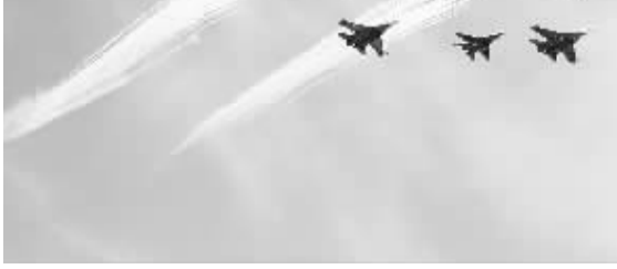
5月9日,在俄罗斯首都莫斯科,苏-27和米格-29战斗机编队从阅兵式上空飞过。