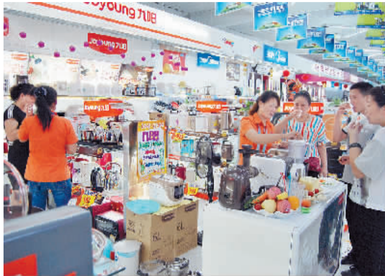
高端榨汁机、面包机等家电逐渐走进寻常百姓家。

苏宁电器在端午节年中庆促销活动中,主推的彩电、空调、冰洗、小家电类智能新品,受到消费者欢迎。据苏宁电器经理介绍,和往年相比,今年的中高端家电产品卖得比较好。数据显示,线上中高端家电产品销售占比32%,其中50英寸以上的智能电视占销售总额的74%,曲面电视的占比达到了