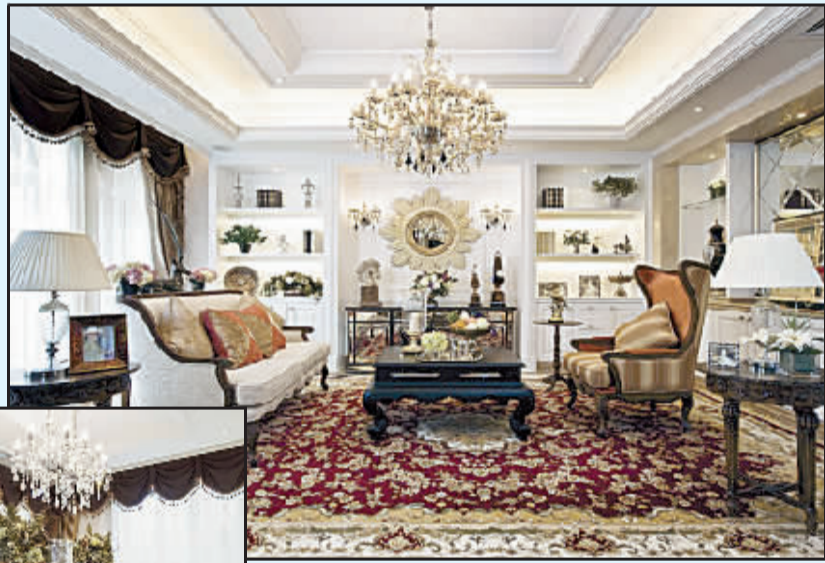
现代美式风格给人的感受是豪华大气,却又拥有着古典气质和浪漫气息。