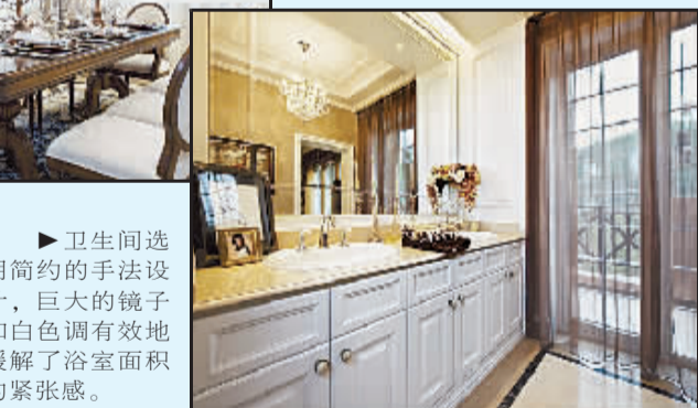
厨房以原木色为主,用大量的木质色彩营造出一种自然舒适的生活环境。

美式风格大多采用实木家具,崇尚古典韵味,怀旧之情溢于言表。美式风格造型较为随意,线条流畅,主要考虑实用性和舒适性。