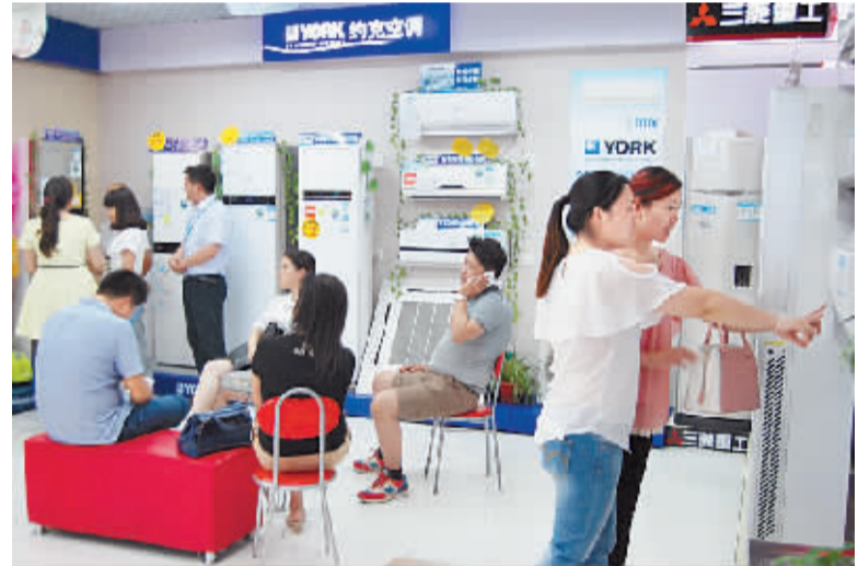
苏宁开展“年中庆决战全网”促销活动,通过一系列的让利和贴心服务,打造一个盛大的购物狂欢节,受到消费者欢迎。