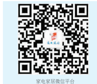
家电家居微信平台

国产品牌也借机发力,销售人员告诉记者,国产品牌的小家电品类更全,所以九阳、美的等国产品牌小家电更能吸引消费者的注意力。这几天小家电销售情况特别好,以前外资品牌是消费者主要的选择对象,但是现在,国内的几个一线品牌,不管是品类、外观、功能,甚至价格都不输于外资品牌,促销力度也更大,如九阳电器推出的“粽情端午惠动全城”活动,不仅推出了多款全球首发的豆浆机、榨汁机、面条机、压力煲,活动期间购物还有大豆纤维被、炒锅、陶瓷刀具、不锈钢锅具等礼品赠送,为消费者带来实惠的同时也为卖场赢得更多消费群体的关注。@5