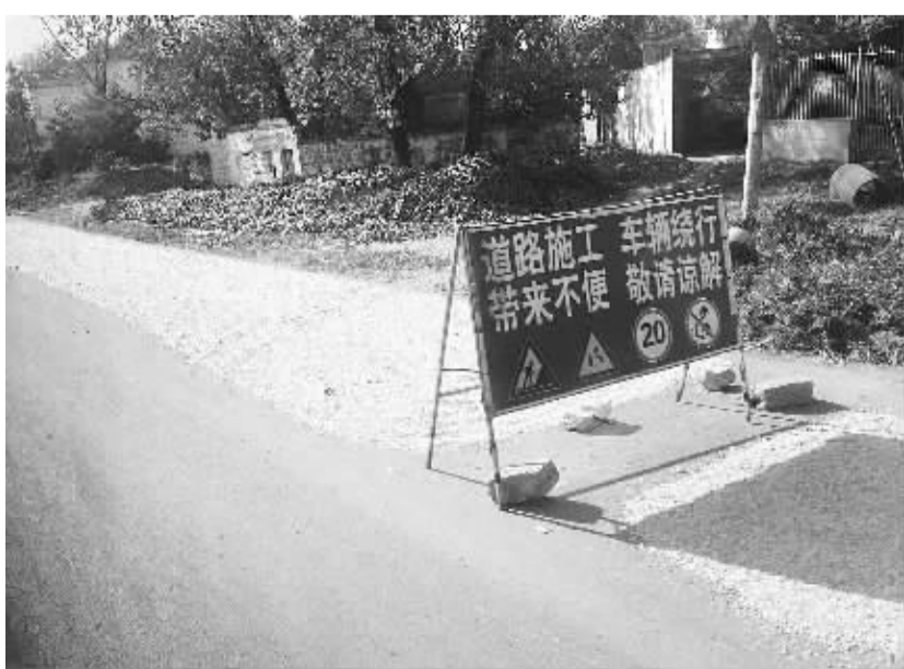
南郑一级公路青华段公路晒粮现象普遍,存在很大交通隐患。