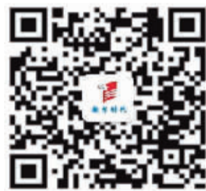
南阳日报通信专刊部 微信公众平台

信不要轻易回复, 不明链接不要轻易登录, 任它东南西北风, 我自岿然不动就好。⑩11