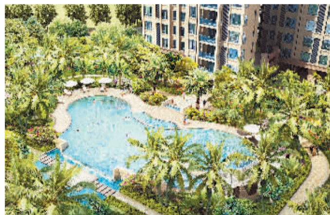
温泉泳池效果示意图

好地段、好房子、好园林、好物业, 55m 2 —135m 2 瞰海户型, 抢房火爆进行中