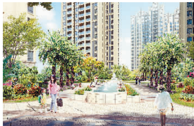
庭院景观效果示意图