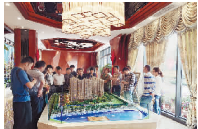
南阳看房客户络绎不绝

2016 年已悄然来临, 宇信品质地产 10 周年辉煌历程璀璨夺目, 南阳中心城区“22 中名校旁的显赫家族”宇信凯旋华府及“南阳河景楼王”宇信凯旋公馆火爆热销的同时, 宇信地产首个跨区域开发项目海口宇信西岸公馆也备受市场追捧, 成为南阳成功人士滨海度假圈层生活的最佳选择。