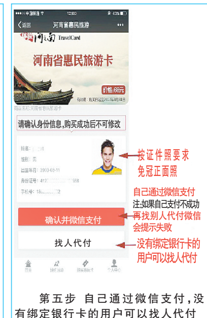
第五步 自己通过微信支付,没有绑定银行卡的用户可以找人代付