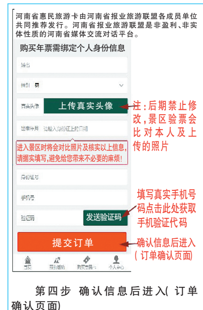
第四步 确认信息后进入(订单确认页面)