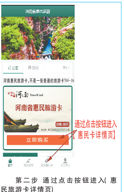
第二步 通过点击按钮进入(惠民旅游卡详情页)