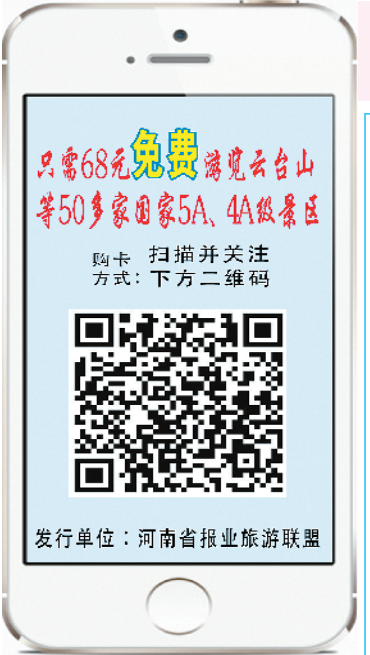
第一步 扫描二维码