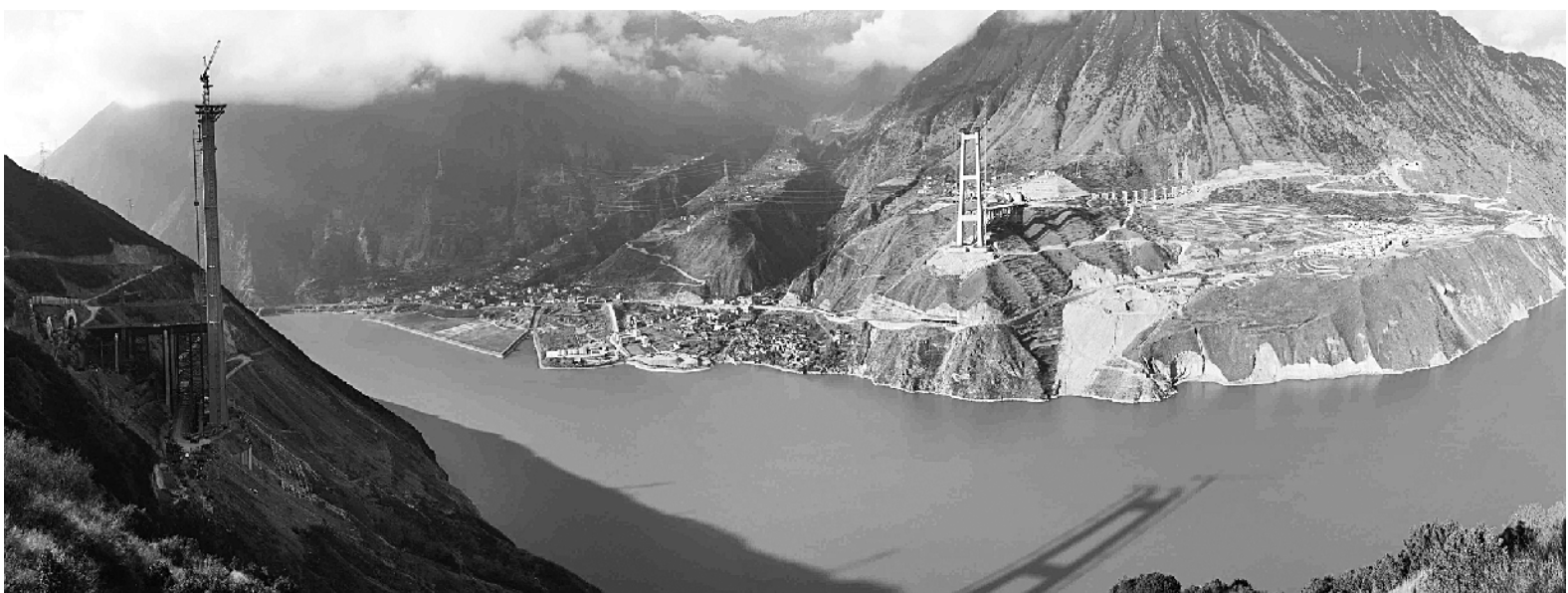
寒冬时节，一条横跨十几个断裂带的“天路”正在云雾中修建。雅康高速是国家高速公路网雅安至叶城（新疆喀什）高速公路的重要组成部分，建成通车后，从雅安至康定只需一个半小时。图为建设中的雅康高速公路控制性工程之一——1411米长的大渡河特大桥。

索创新。意见还要求，整合分散设立的各类公共资源交易平台，立足公共服务职能定位，完善管理规则，优化市场环境，着力构建规则统一、公开透明、服务高效、监督规范的公共资源交易平台体系。依托大数据、云计算等信息技术，加快推进交易全过程电子化，实现交易全流程公开透明和信息共享。