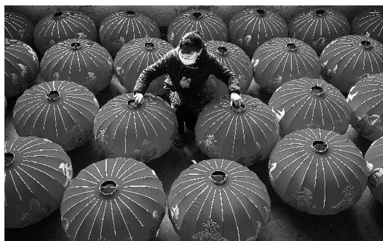
安徽省合肥市开明工艺宫灯制造有限公司是一家专门生产中国传统红灯笼的民营企业。该公司每日可生产3000余只红灯笼，其中不少是来自美国、东欧国家以及东南亚国家的订单。

通知要求，各地要健全完善组织领导，调整充实省市县三级征兵领导小组和征兵办公室，4月1日起全面展开日常工作，并逐级组织业务培训；强力推进征兵报名率、上站率、合格率、择优率、退兵率落实，把征兵实施的各环节纳入考评体系，落实责任追究；严密组织兵役登记，6月30日前完成兵役登记任务，2016年未登记的必须全部补登；广泛开展征兵宣传，切实把征兵宣传工作做细做实；扎实做好高校预征，努力提高大学生预征对象上站率；配齐完善政策制度，切实提升军人军属荣誉感。