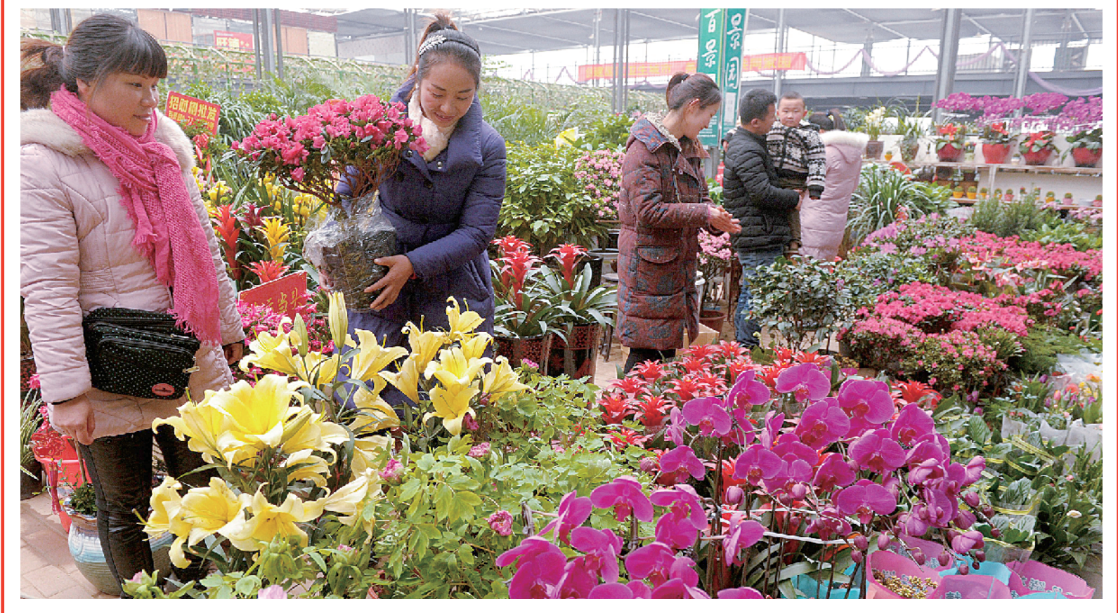
春节前夕,第三届新春花市在漯河物流园举行,数百个花卉品种争奇斗艳,吸引了众多居民前往观赏。④1

据了解,市质量技术监督局自1月5日至2月15日,在全市范围内集中组织开展计量专项检查,进一步规范市场秩序,给广大消费者营造公平、安全的购物环境。⑤2