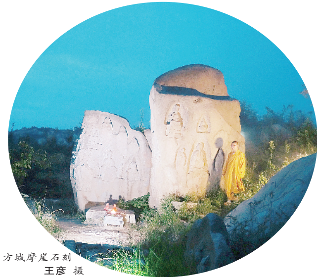
方城摩崖石刻

3月6日,备受全国摄影爱好者关注的,由南阳网、方城县旅游局、光影中国网联合举办的“丝路之源·生态方城”全国摄影大赛评选活动在南阳落下帷幕。本次摄影大赛参赛作品题材广泛,创作风格各异,富有浓烈的时代气息,无论是创作水平还是投稿规模,都堪称光影中国网近年来阵容较为强大的赛事之一。本次摄影大赛的成功举办,将对加大方城旅游宣传力度、加快方城旅游产业发展产生积极作用。 “丝路之源·生态方城”全国摄影大赛自2016年4月开赛以来,吸引了全国众多摄影爱好者和摄影精英踊跃参与,至2016年12月底截稿,收到参赛作品共计749幅(组)。光影中国网评审团本着“公平、公开、公正”的原则,经过认真初选和对纸质复选作品的现场评选,共有56个奖项出炉。