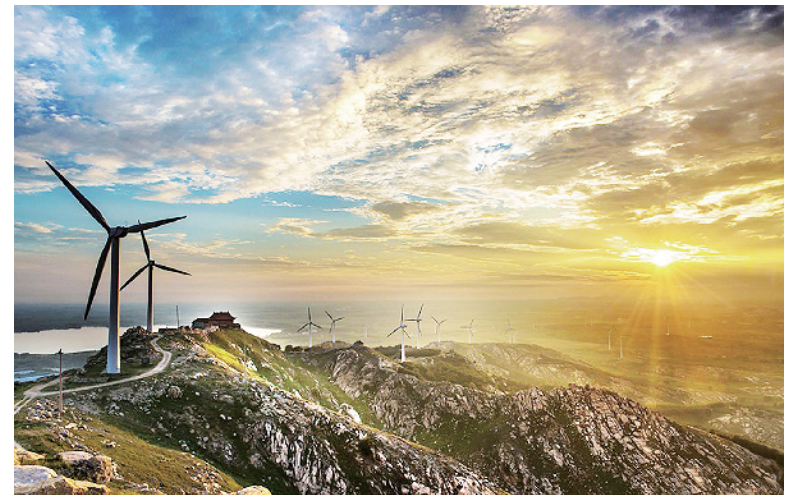
方城风光