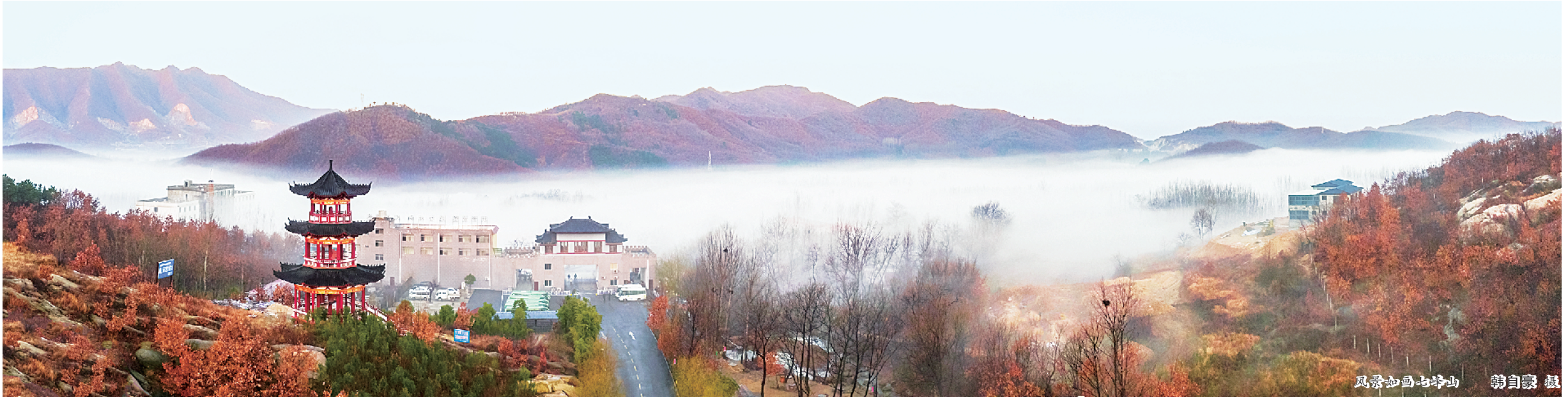
风景如画七峰山