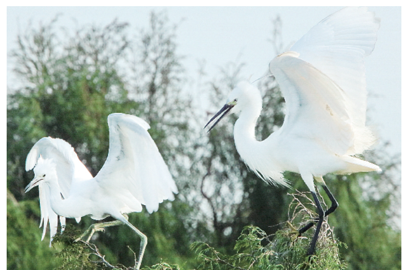
生态望花湖