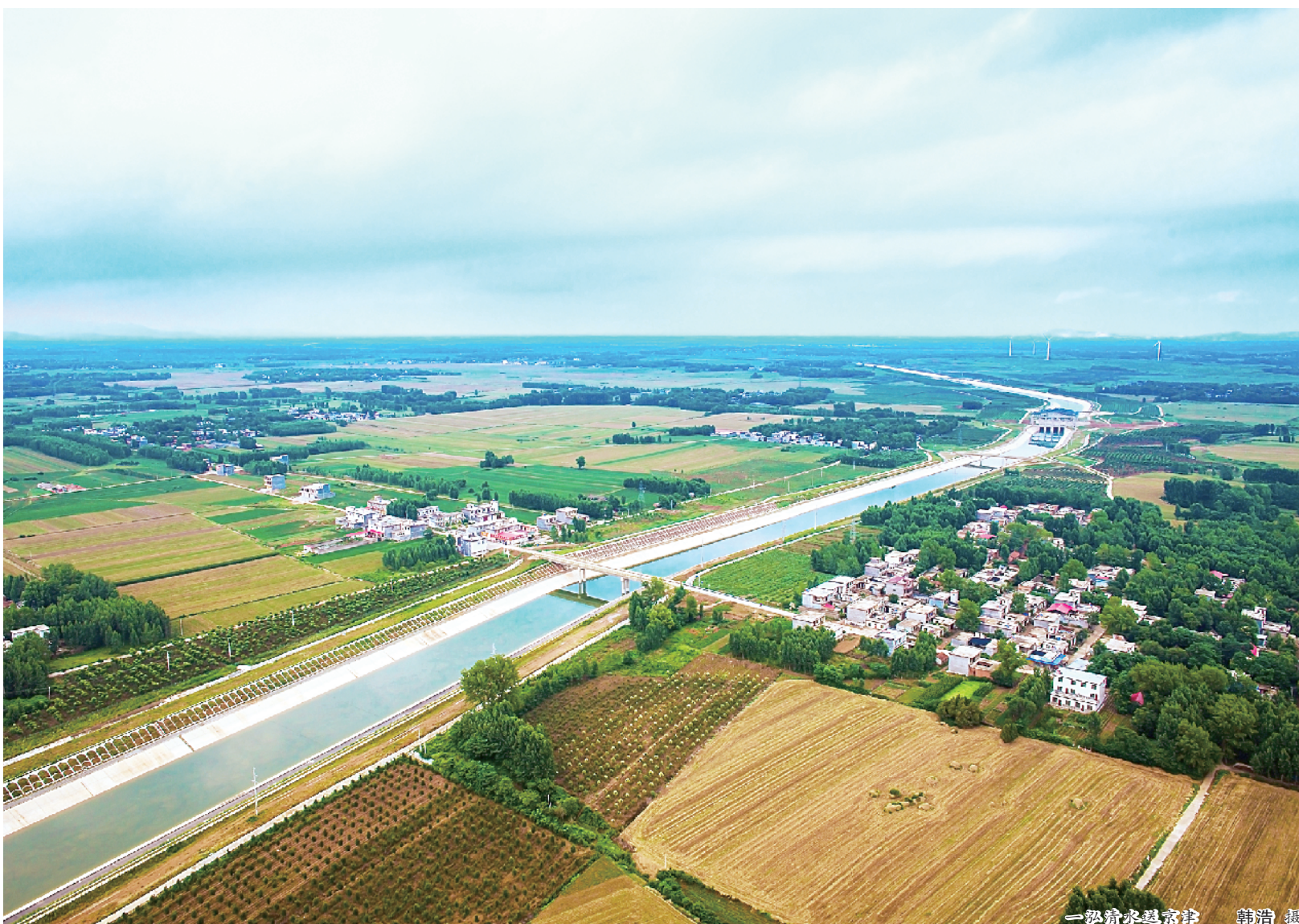
一泓碧水绕方城