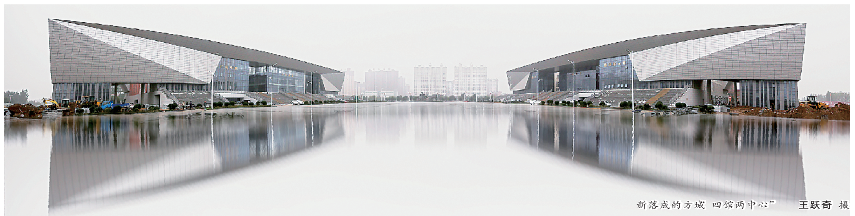
新落成的方城 四馆两中心”