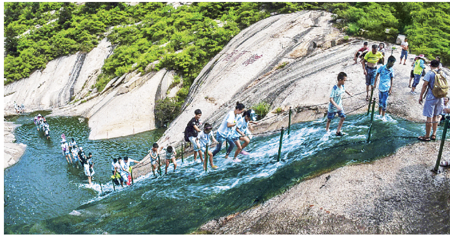
攀援者的乐园