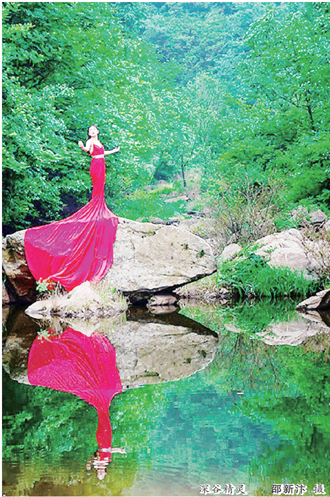
深谷精灵