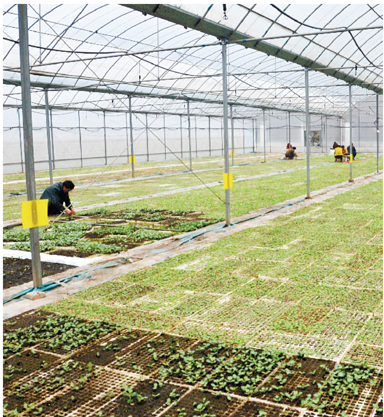
西峡县加快土地流转,建设专业化、规模化烟叶生产合作社,引导农户大力发展优质烤烟,每年为农民带来直接收入5000万元 ③10

汉江流域城市政协联系协作会第七次会议于4月26日至28日在我市举行。本次会议围绕“推进生态文化旅游产业协同发展”主题进行广泛协商和深入探讨,积极为促进汉江流域城市联动融合发展建言献策、凝聚共识。会议期间,与会委员将实地考察南阳文化旅游、生态农业发展情况,并参加南阳第十四届玉雕节暨玉文化博览会开幕式等活动。③10