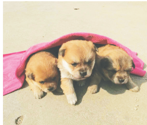
三胞胎 市十二小 三(四)班 勾庆锦