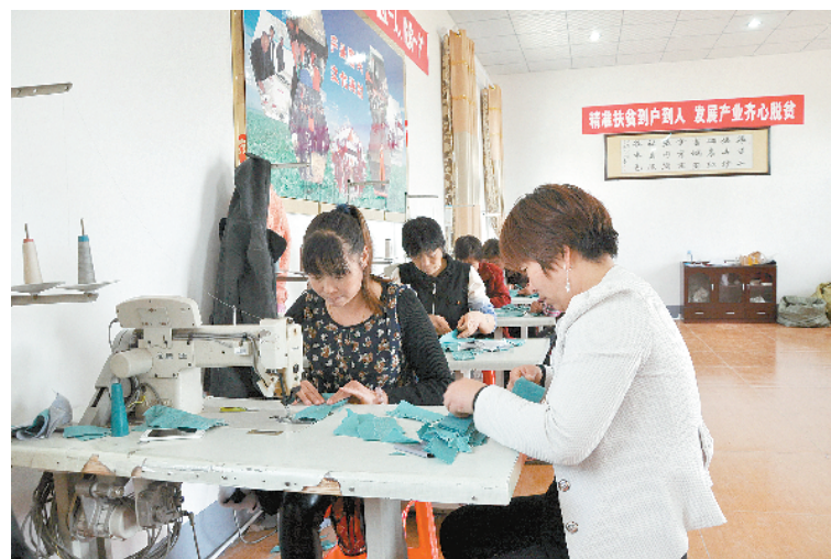
内乡县余关镇王沟村党支部建起扶贫产业园,带领村民就近务工脱贫致富 ⑧9