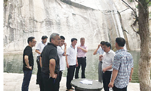
市旅游和外事侨务局有关负责人在景区现场研究整改方案