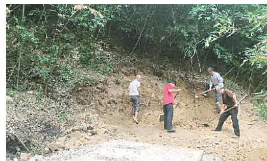
景区厕所改造施工现场