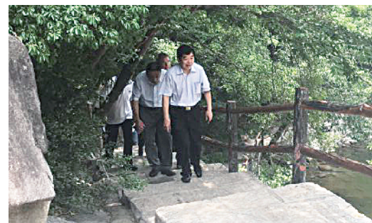
市旅游和外事侨务局有关负责人现场检查景区整改情况