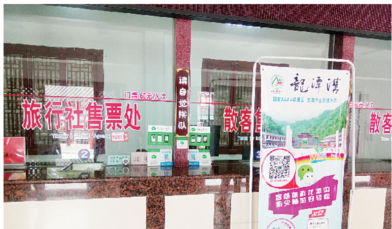
售票处实现微信支付支付