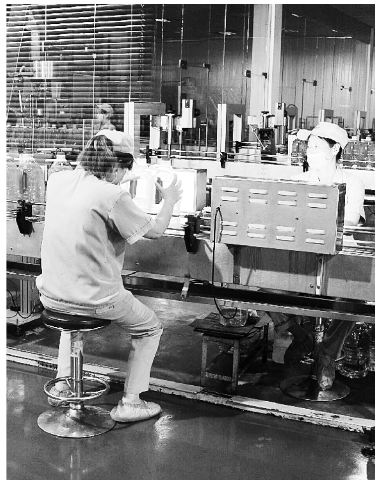
南阳市瑞丰粮油有限公司生产的“吉祥结”6大系列20余个品种热销省内外。③10

市人社局作为具体实施部门,迅速成立组织机构,明确责任分工;充分开展调研,攻坚遗留问题,确保该项政策在精准扶贫中发挥更加积极的作用。同时组成4个督导组,对各县区城乡居民医疗保险政策及一站式即时结算工作落实情况督导检查。针对前期工作中的薄弱环节,制定了结算情况日报制度,每天由保险公司向市医保中心通报当天结算进度。发现有工作推动不力、任务落实不到位的一律严肃追查相关人员责任。 截至6月2日,我市已完成困难群众大病补充保险即时结算报销3589人,完成手工报销800人。③8