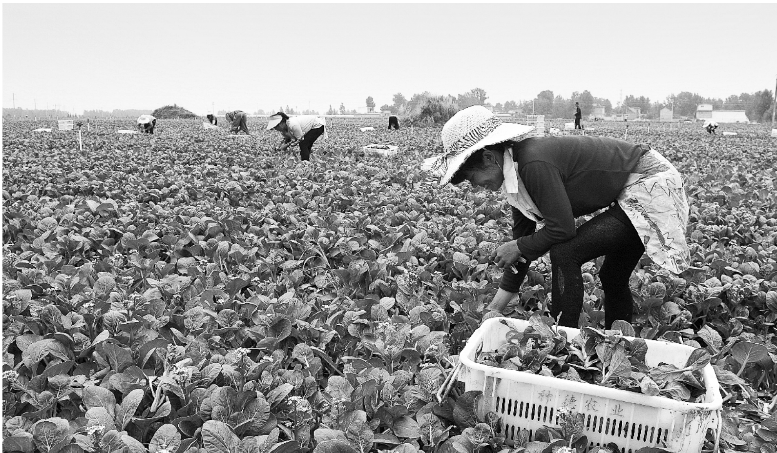
南阳种德农业科技有限公司万亩保供蔬菜基地一期投资2100万元,建设示范园2600亩,年产保供蔬菜2100万斤,实现销售收入6900万元。③10