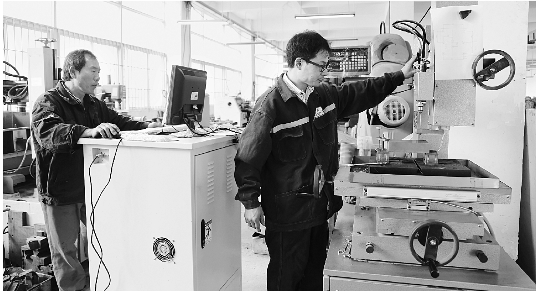
位于桐柏县产业集聚区的南阳恒特电气有限公司,总投资1.5亿元,年产各类中高压输电产品200余万套,产品畅销美国、韩国等十多个国家 ⑬4