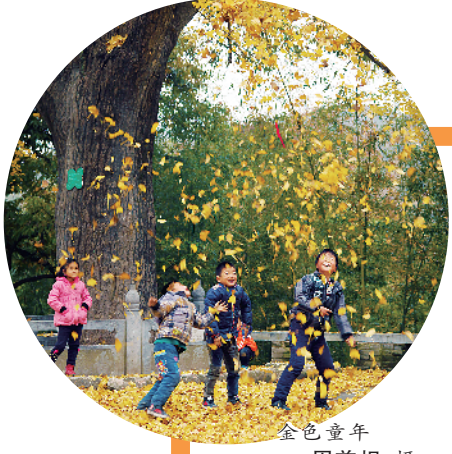
金色童年