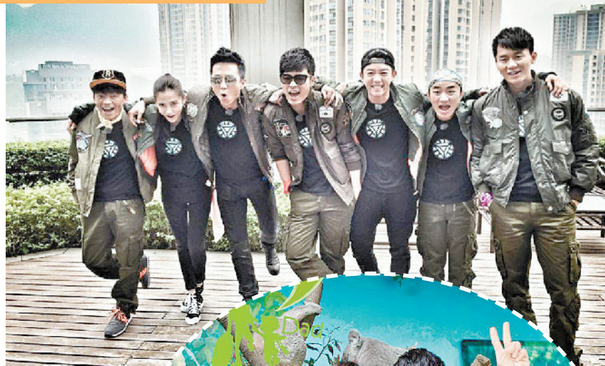
▲《奔跑吧兄弟》捧红了跑男团

在投资方疯狂砸钱的同时，大多数节目都在堆明星。《十二道锋味》《偶像来了》《真正男子汉》等都摆出全明星阵容。