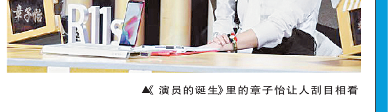
▲《演员的诞生》里的章子怡让人刮目相看