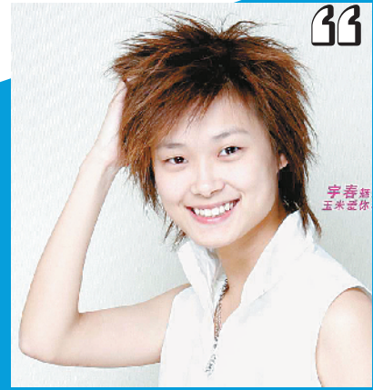
李宇春成为国内电视选秀史上的标志性人物

12年前“超女”开启了电视综艺的黄金时代，之后的一段时间里，综艺节目成为各大卫视的重头戏。然而，随着网综的崛起，特别是近两年，电视综艺却走出了一条“滑落曲线”。