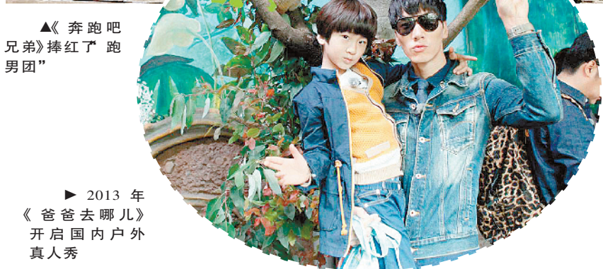
▶ 2013年《爸爸去哪儿》开启国内户外真人秀