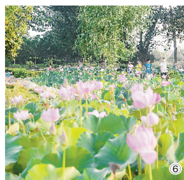
图④ 一渠清流 永续北送 图⑤ 北方水城 名副其实 图⑥ 宜居宜业 美丽南阳