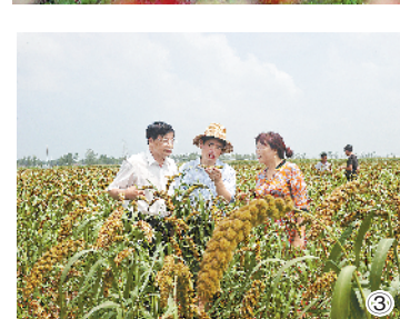
图① 避暑养生 度假乐园 图② 红叶满山 层林尽染 图③ 有机农业 高效惠民