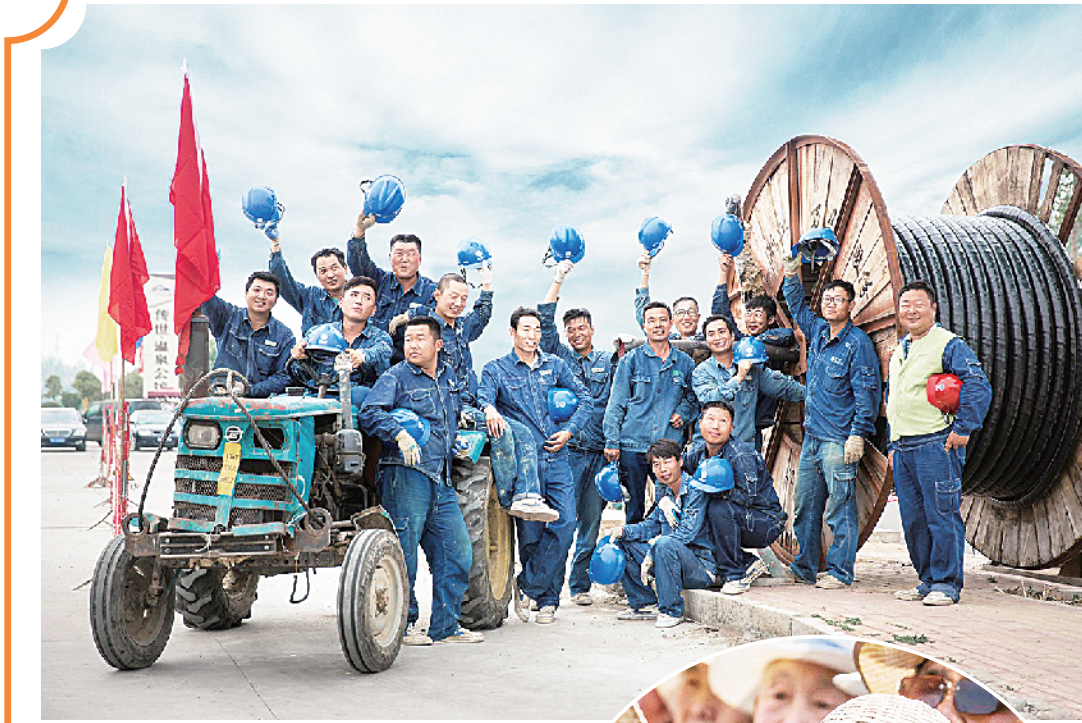
▲劳动者风采 程传照 摄 ▲如醉如痴 何元生 摄 ▼樱桃熟了 何进文 摄