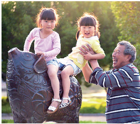
▲祖孙情深 ▼快乐童年