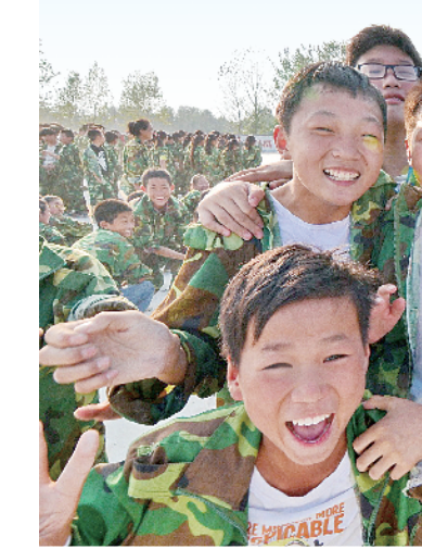
▲祖孙情深 ▼快乐童年