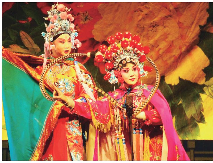
资料图片 管剧团演员奖、民营剧团演奏员奖若干名;视参赛单位对本次大赛的重视程度、获奖成绩等设优秀组织奖和组织奖若干名。

展和创新。参赛作品长度为8分钟以内,超过8分钟,将扣除一定分值。曾参加过省级以上青年演员大赛并获奖的选手不得参加本次比赛。