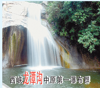
西峡龙潭沟中原第一瀑布群