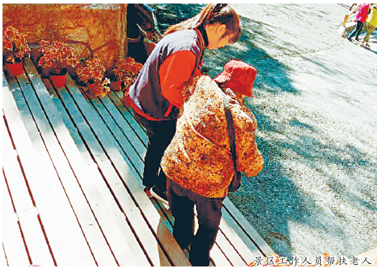
景区工作人员帮扶老人