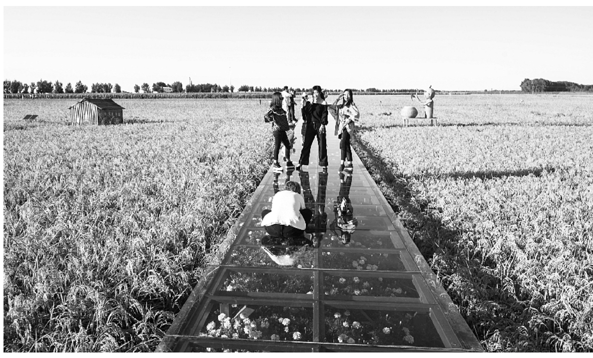
在吉林省舒兰市溪河镇,游客在稻田间的玻璃栈道上拍照留念 ⑤4