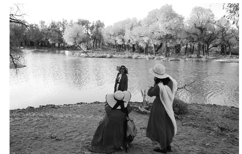
金秋时节,内蒙古自治区额济纳旗胡杨林如同披上金装,成为大漠中的一抹亮色,吸引众多中外游客前来观赏游玩 ⑤4 新华社发