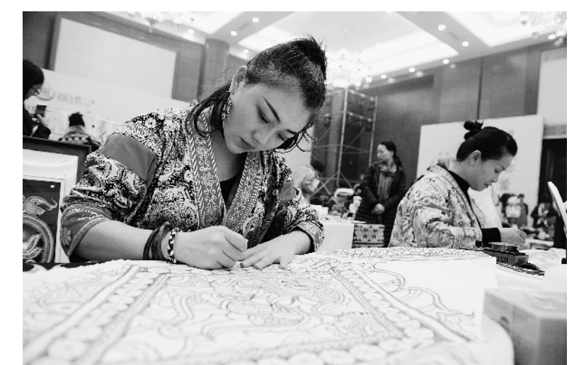
贵州省妇女特色手工技能暨创新产品大赛在贵阳市举行,贵州省锦绣计划“实施”五年来,培训妇女6.5万人次,帮助全省众多妇女织就脱贫致富路 ⑤4