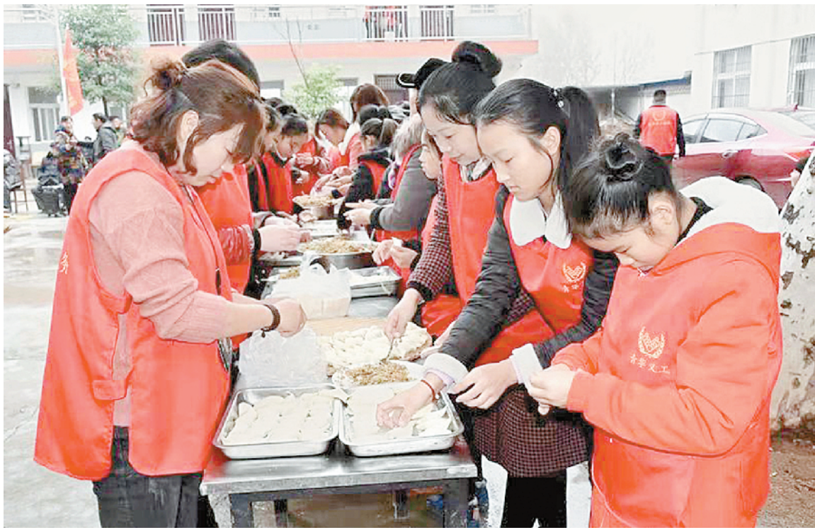
11月18日,卧龙区青华镇义工服务站义工,到该镇敬老院开展“快乐星期天”慰问演出活动,为老人们包饺子、唱大戏,陪老人们度过了一个快乐温馨的周末 ⑥6

项目实施地域为南阳市区,实施时间为2018年11月至2019年10月。届时,宣讲团将联络相关单位,围绕公益宣讲团的八项内容,根据各单位不同需求,提供相应的宣讲服务180场,并开展12场大型公益培训。⑥2