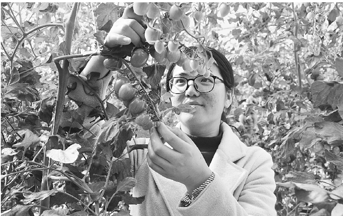
引进顶尖技术 发展高效农业

“N”即围绕磷素、食用菌、苗木花卉、中药材、艾草6个特色产业,培育龙头企业,带动贫困户增收;“N”即围绕磷素、食用菌、苗木花卉、中药材、艾草6个特色产业,培育龙头企业,带动贫困户增收;“N”即围绕磷素、食用菌、苗木花卉、中药材、艾草6个特色产业,培育龙头企业,带动贫困户增收。