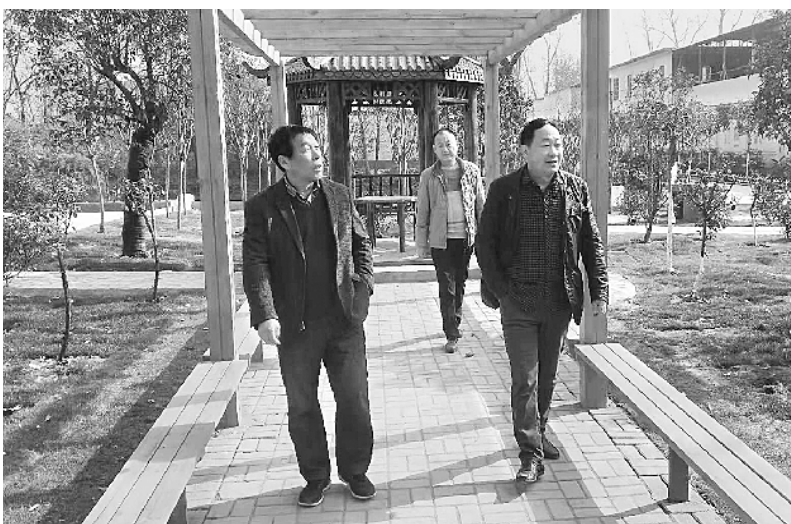
宛城区溧河乡沙岗村投入60多万元开展环境卫生综合整治,如今游园别致,风景优美,村庄面貌焕然一新 ③7 通讯员 党建伟 报

初冬季节,笔者在宛城区茶庵乡葛营村看到,干净的村庄,整洁的房舍,平坦的乡村小道上,村民在散步、休闲。该村党支部书记指着村边的水沟告诉记者:“以前这里堆满了粪便,让村民苦不堪言;如今经过治理、清淤,环境好了,心里真是高兴。” 据了解,“茶庵乡葛营村南边,养猪场、养猪场污水粪便乱排入村里水沟”案件是今年六月份中央环