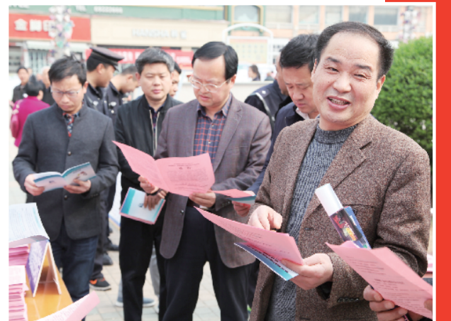
领导干部带头学法