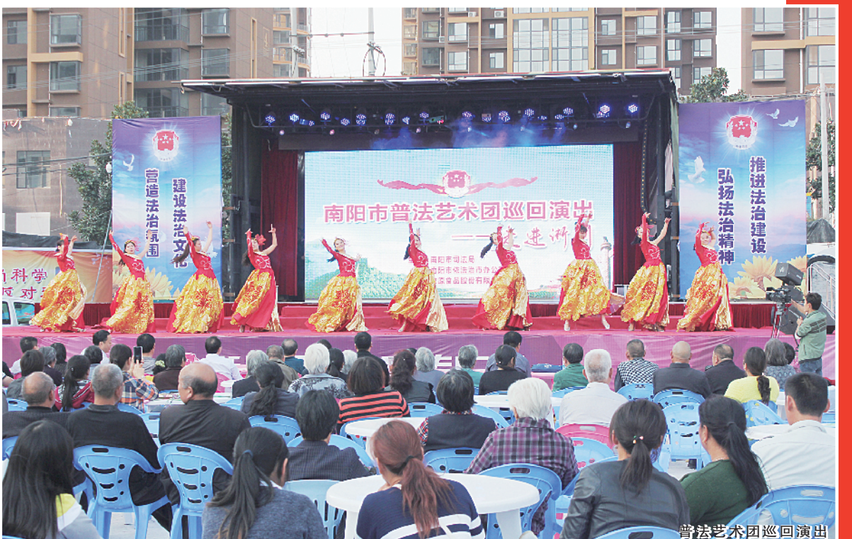
普法艺术团巡回演出