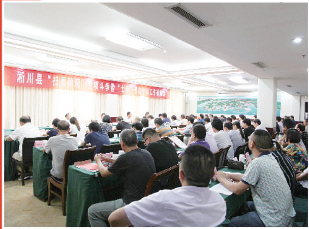
扫黑除恶专项斗争宣传