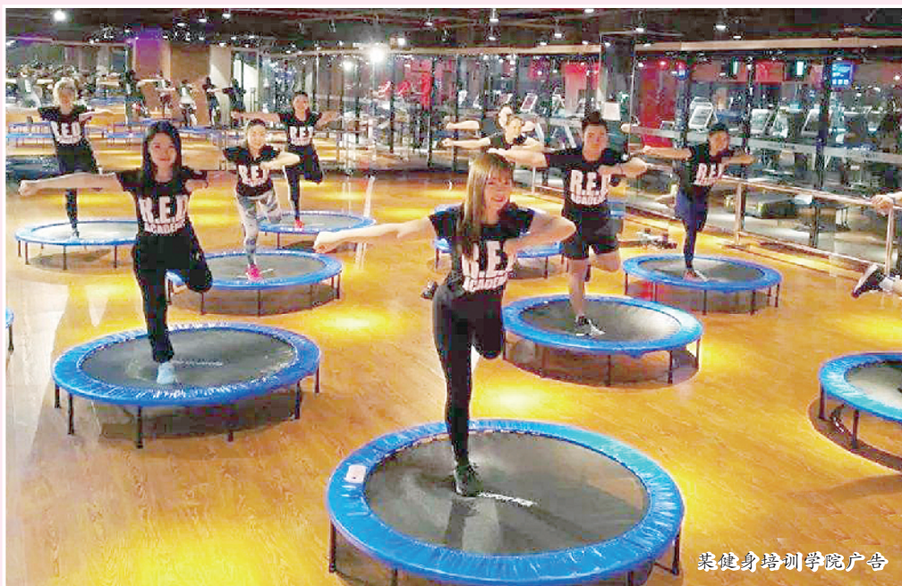
某健身培训学院广告

二大爱好。目前我国参与运动的人群每月运动频次达到7.5次，年均健身花费达1万元。健身行业发展前景可观，但面临的困难也不小。