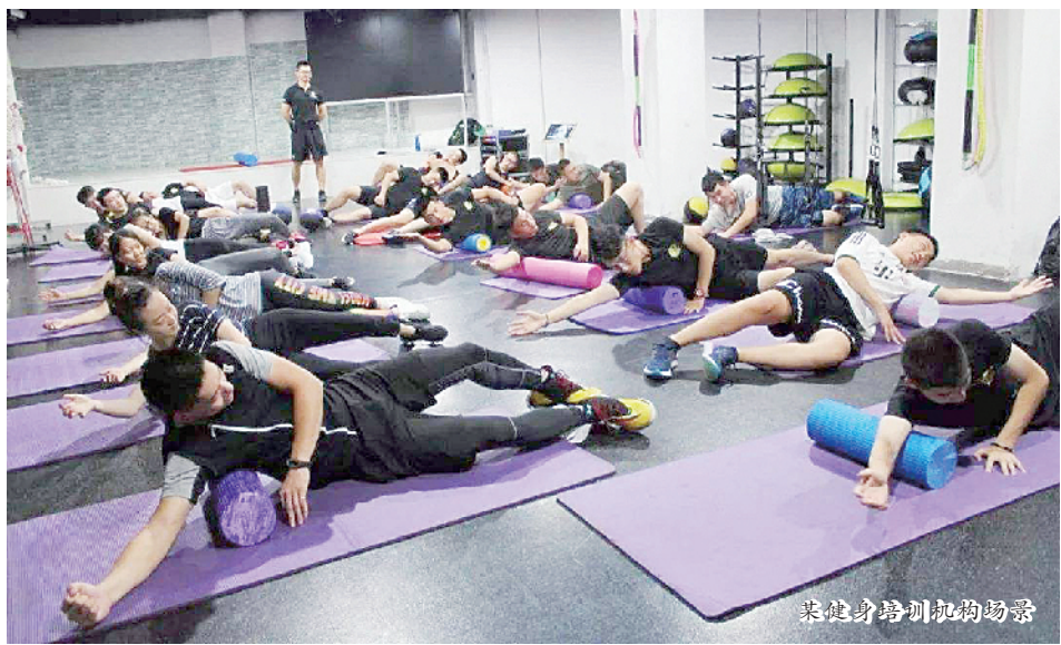
某健身培训机构场景

“智能+”已经成为健身领域的一大发展重点。包含大数据处理、云计算、传感技术等先进科技手段的智能硬件与智能软件融合，可以使健身具有更强的计划性、针对性和科学性。尤其是在缺少专业教练指导的家庭健身中，智能化健身器材更能使健身效果最大化。⑩1（据新华社）