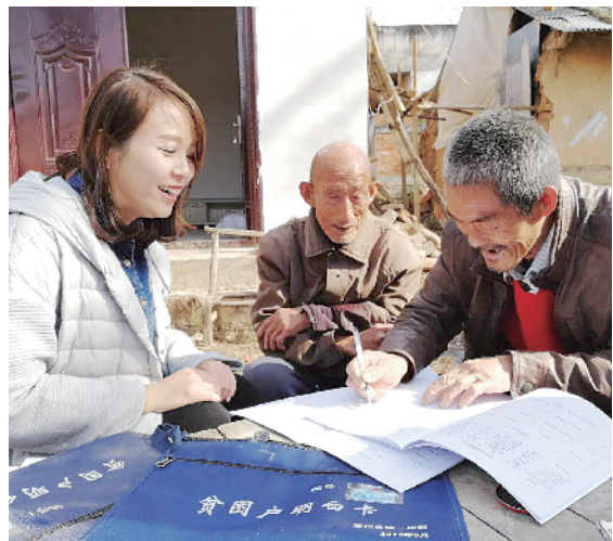
扶贫干部扶贫帮扶

脱贫攻坚是锻炼干部的主战场、检验干部的试金石。至2018年底,该县先后评选各类先进典型1100余人,提拔重用扶贫干部130余人,5名被评为“明星”和“功勋”的村支部书记享受了副科级待遇,极大地提振了党员干部的精气神。累计督促整改问题1200多处、公开公示党务村务7500多项,先后党纪处理113人,组织处理16人,警示约谈110多人次,基层信访量下降30%,拧紧了责任链、打通了执行链、凝聚了强大合力。