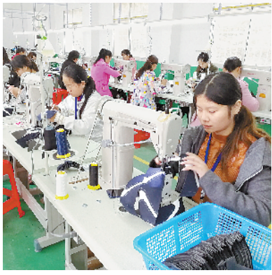
西黄乡卧龙岗鞋业扶贫车间