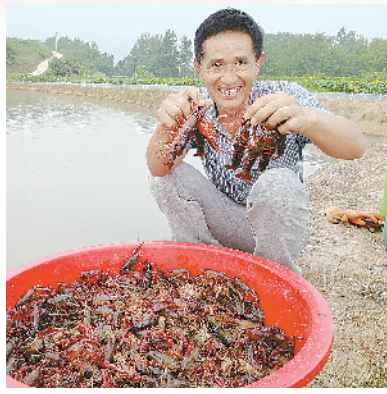
马蹬镇小龙虾养殖基地