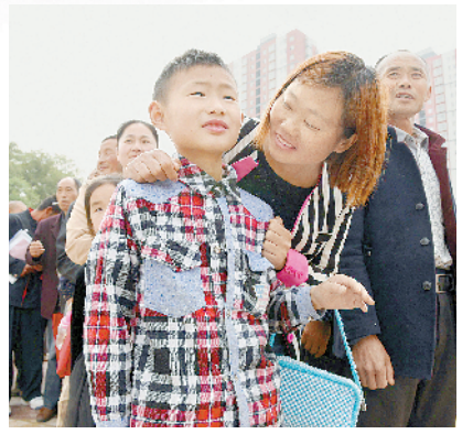
贫困户到新家难掩喜悦