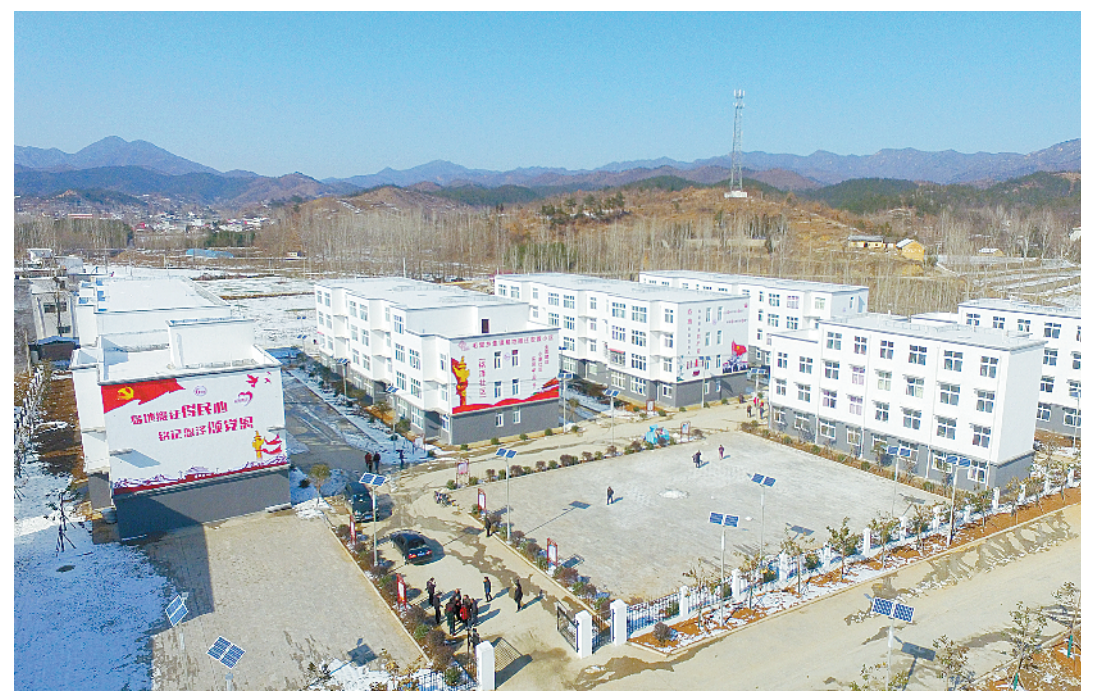
毛堂乡易地扶贫搬迁集镇安置点——铭泽社区