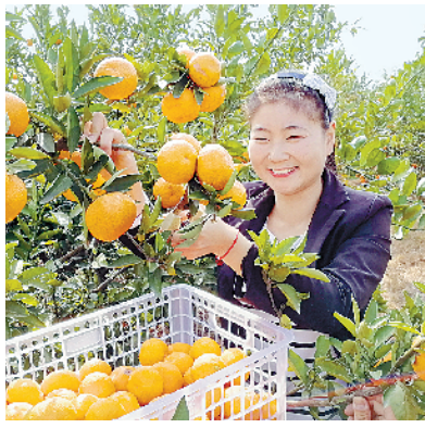
游客采摘 丹江蜜橘