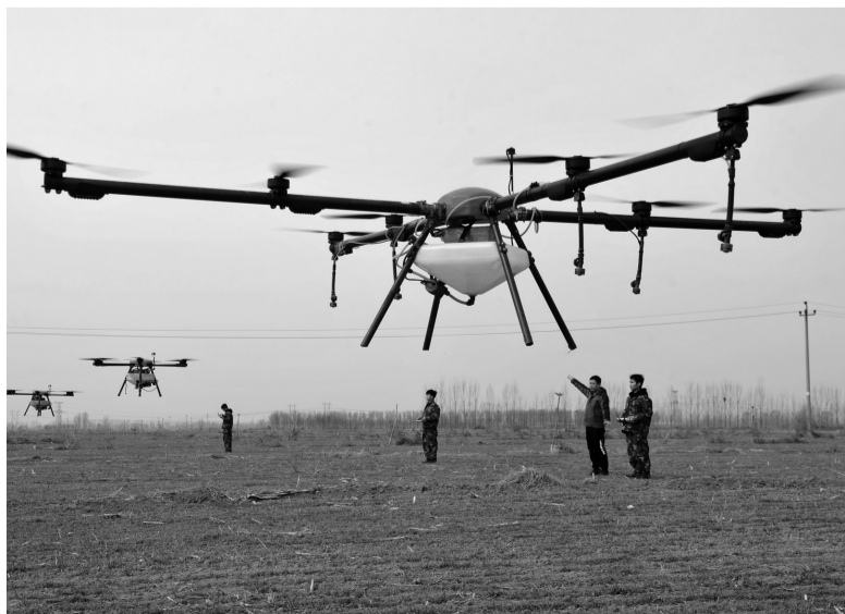
2月27日，合作社社员在测试农用无人机。时下，华北平原冬小麦春季管理陆续展开，河北省泊头市农业部门及相关农机专业合作社加紧对农用无人机等设备进行检查维修，保障春耕生产顺利进行 ⑤3