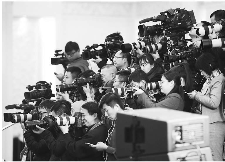
记者在“部长通道”采访 ⑤3