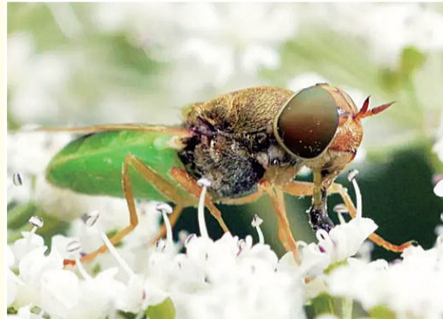
←绿腹兜蝇