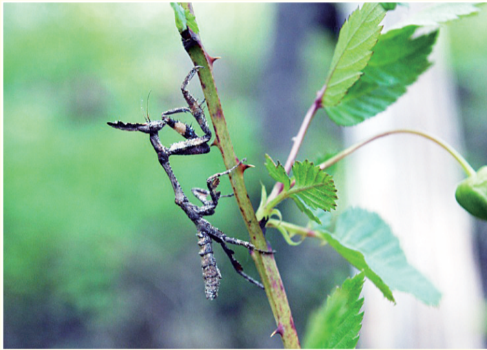
↓汉冠螳螂

境内拍摄的。他认为，南阳盆地地处北纬33°南北交界地带，南方北方的昆虫都能在此繁衍生息，堪称昆虫的故乡，有着丰富的昆虫资源。