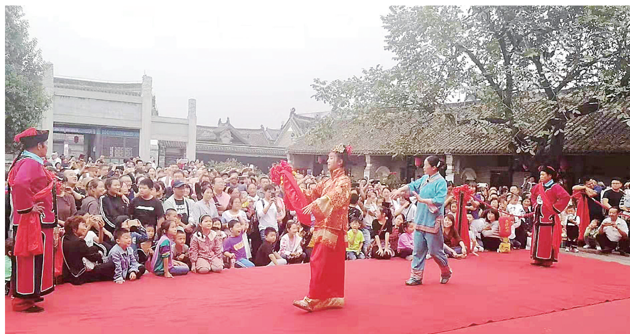
在内乡县街举办的《知县招婿》民俗互动演出吸引大批游客观看 ②10