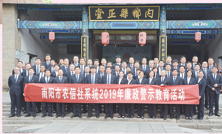
南阳市农信社系统2019年廉政警示教育活动现场合影