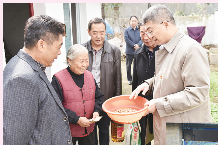
工行南阳分行有关负责人到扶贫帮扶村——宛城区高庙镇郭厂村,了解贫困群众的生活情况。3年来,该行投资33万元为郭厂村购买垃圾清运车、花生脱粒机、拖拉机、旋耕机,建草莓种植大棚,精准助力郭厂村打赢脱贫攻坚战,被市委、市政府授予“千企帮千村”先进企业

本报讯 (通讯员李万鑫)洛阳银行南阳分行积极服务实体经济,贷款投放额度和审批效率显著提升,截至目前,贷款余额较2017年翻了两番,支持中小企业的“两增两控”贷款余额增速超过50%。 该行坚持“服务当地经济、服务中小企业、服务城市居民”的市场定位,深入调研南阳当地经济环境、资金运作特点和客户分布状况,支持实体经济健康发展。今年,该行充分发挥“抵押贷款1000万元以内、信用担保贷款300万元以内自行审批”的便利条件,大大缩短了贷款审批时间。②4