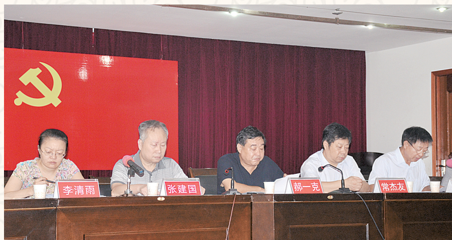
开展“不忘初心、牢记使命”主题教育

群团共建聚能量。开展创建“青年文明号”和“先进党支部”、开展献爱心、组建志愿者服务队、参与环境卫生综合治理等活动,凝聚起强大正能量,强化了员工的归属感和向心力。