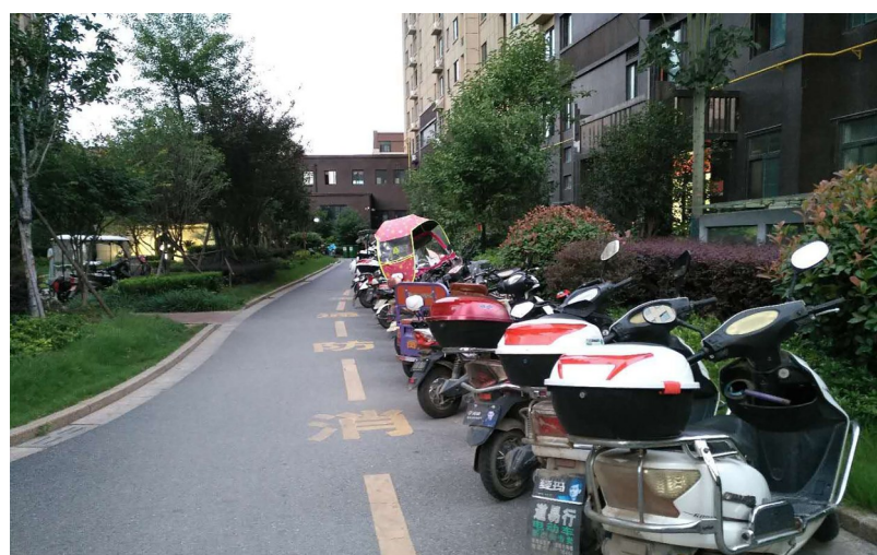
位于中心城区张衡西路的某小区，电动车乱停乱放现象普遍，占用了消防通道，造成了安全隐患 ②8