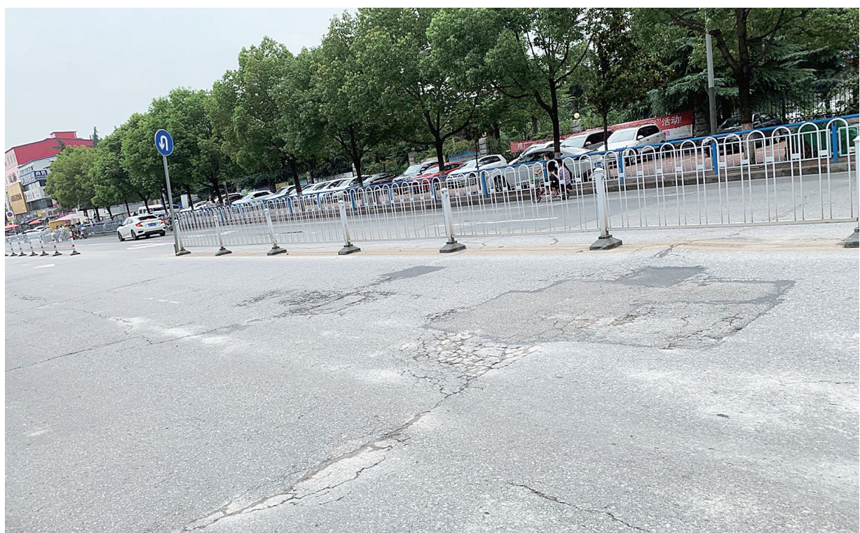
卧龙路西段路面破损严重 ②8

在道路绿化方面，他建议采取多种好树和间种的办法，既可以栽种景观树、蜜源树，也可以栽种一些有深刻文化寓意的树种。