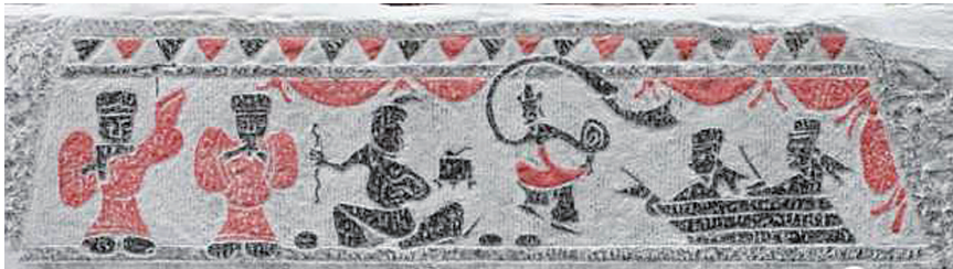
展览现场的部分拓片